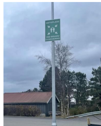
Møteplass: parkeringsplass ved fotballhallen.

Det er leietaker sitt ansvar at gruppen vet hvor de skal evakuere. Leietaker orienterer seg om hvordan rømningsplanene er i forhold virkeligheten.