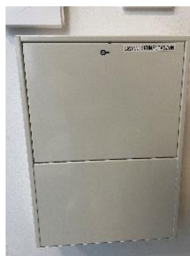
Skap med brandokumentasjon

Det er Leietaker sitt ansvar å tilse at det ikke er blokkerte rømningsveiene med klær, sko og utstyr. Påse at klær og sko legges i garderobene/tribuner. Ved arrangement tar man bort bordtennisbord og utstyr i styrkerommet. Slik at man har frie rømningsveier.